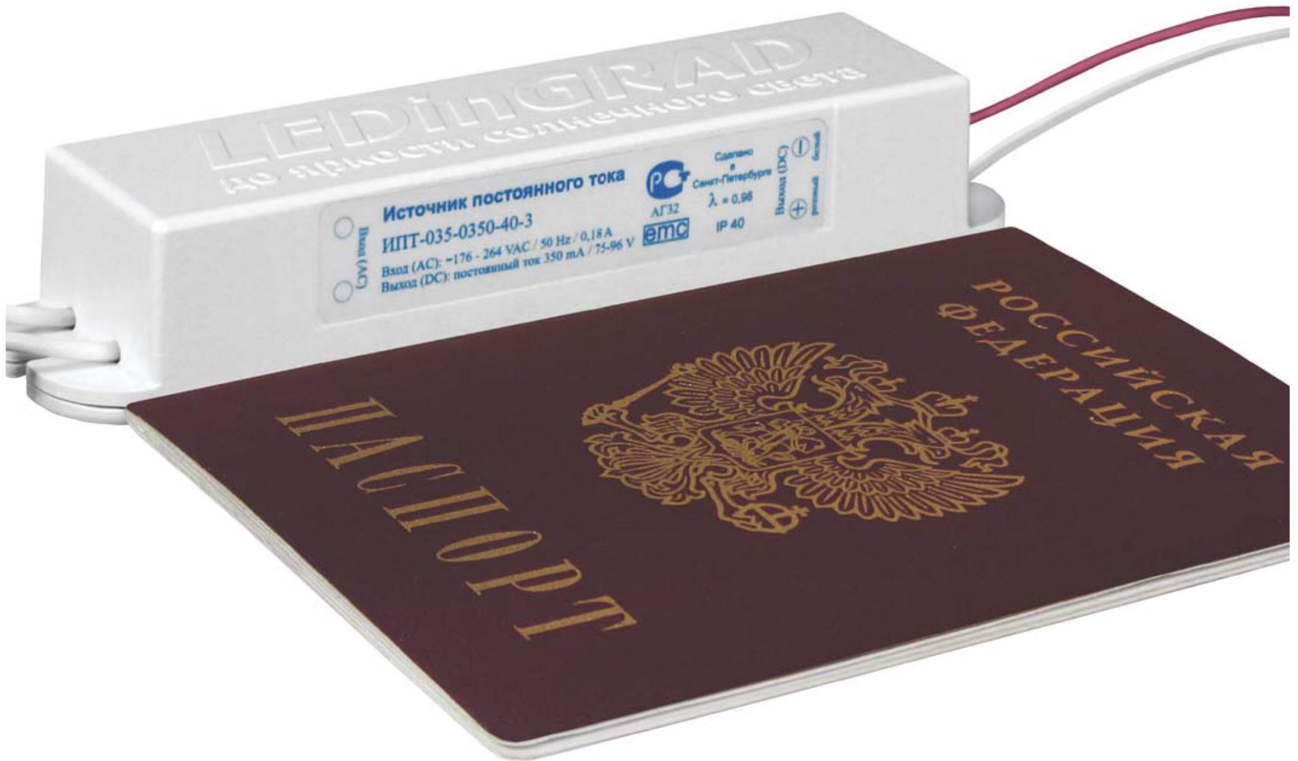
----- РИС. 1. Источник постоянного тока ИПТ-035-0350-40-3 LEDInGRAD